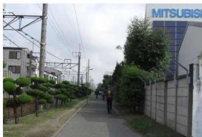
三菱西側の歩道。市民の散歩コースになっています。

御園にお住まいの方から「散歩中にゴミが目立つ。なんとかして欲しい」と相談がありました。