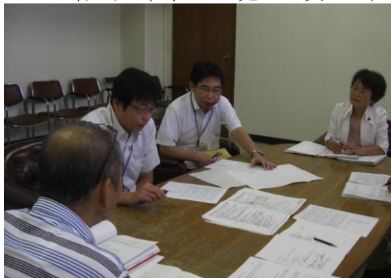
市と懇談する「会」のメンバー（左から4番目が私）

私は、鉄道施設整備促進特別委員会でJR塚口駅を取り上げ、市の対応を尋ねました。市は6月JR西日本にリアフリー化を求め、「土地が狭くて・・・」と言われたようです。更に地元の声をしっかりと発信することが大切です。