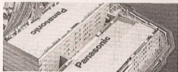
パナソニック尼崎工場