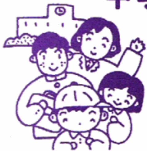
中学卒業まで医療費無料