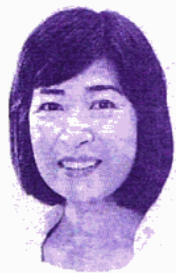
兵庫8区 国政対策責任者