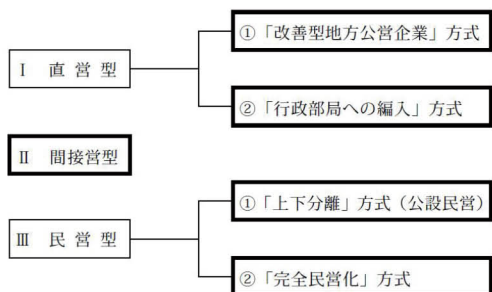
市当局が報告書で示した経営形態のイメージ

尼崎市営バスは、昨年10月の敬老パス有料化で収入が激減。当初、有料化により「3割の乗り控えがあるだろう」との見込みが、実際には、購入者が激減の上、実質「5割の乗り控え」が起きました。